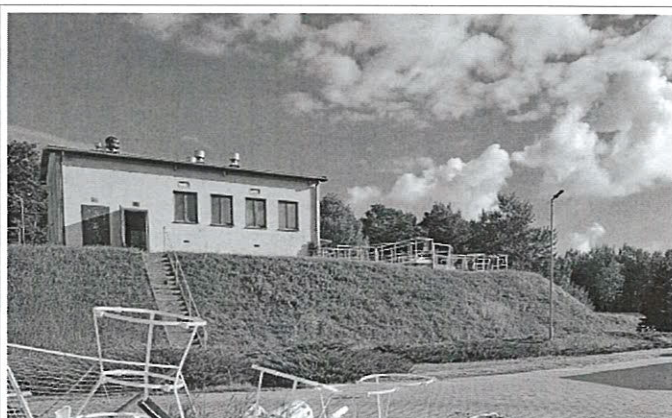
2 – budynek krat